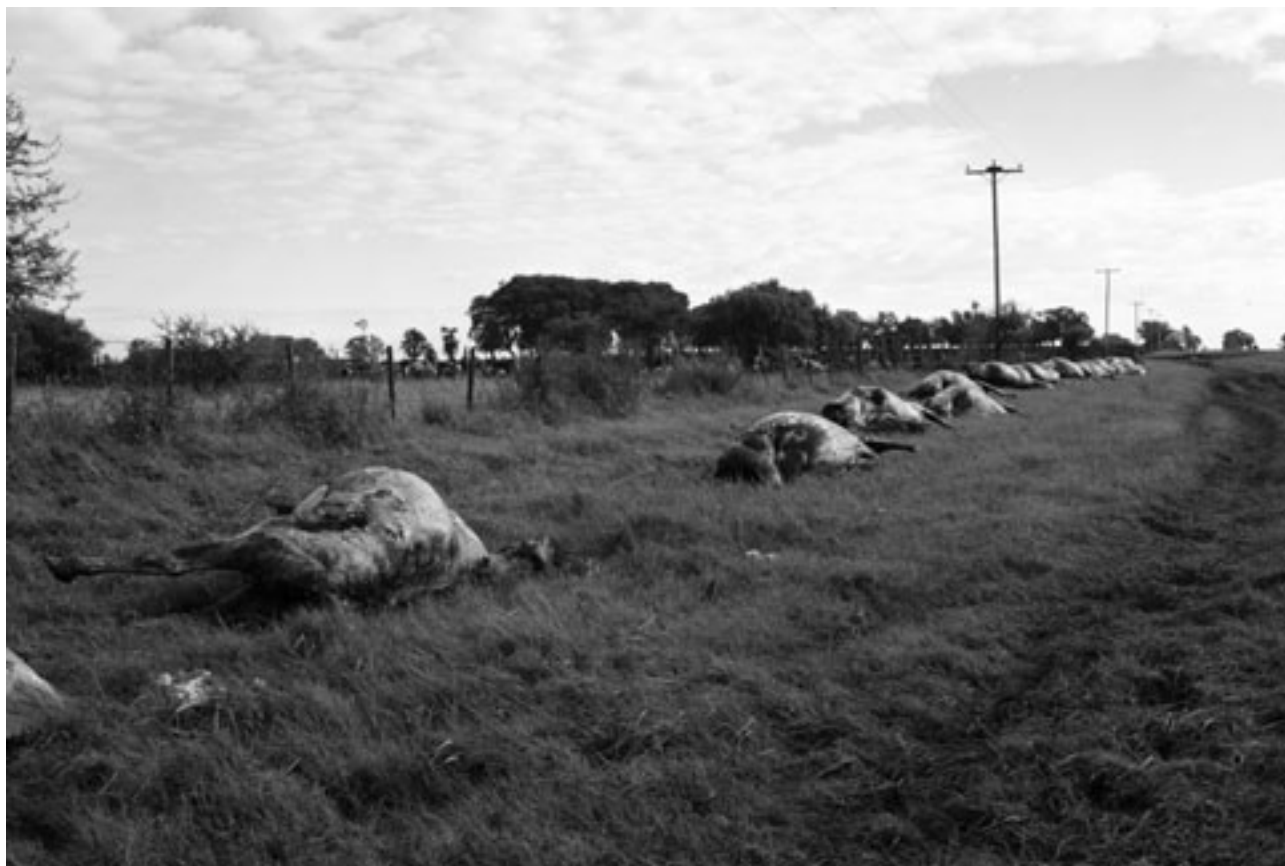
↑ Vacas, de Gustavo Lozano Segundo premio fotografía / Premios Fundación Lebensohn 2007