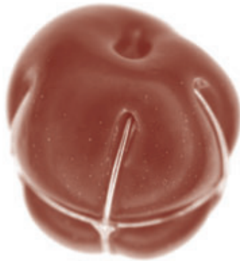
Prunus doméstica III, de Ezequiel Pontoriero Primer premio fotografía / Premios Fundación Lebensonh 2007

Fue, desde siempre, un modo de transmisión de ideología, de representación del pensamiento del poder, espejo de los cambios. Hoy es, también, un medio ideal para sensibilizar en favor de la construcción de un mundo mejor