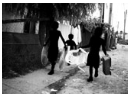
↑ Serie Peeling , de Erica Bohm 1º premio fotografía, Premios Fundación Lebensohn 2006