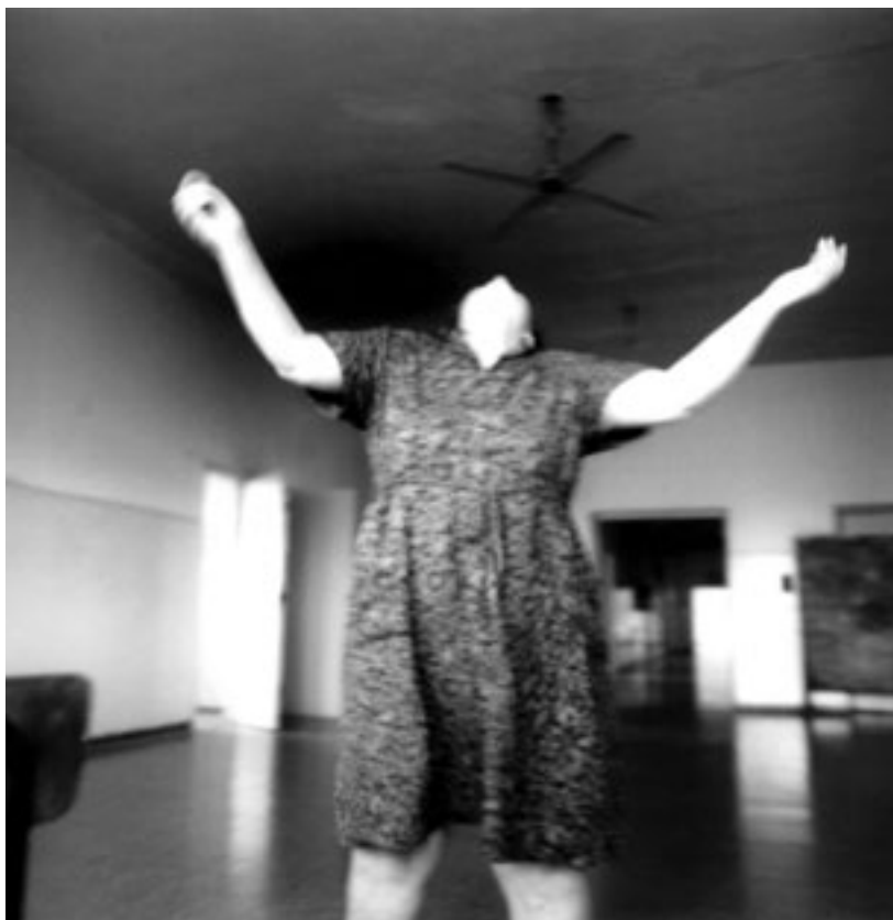
↵ Ausencia de diálogos , de Andras Calamandrei Selección fotografía, Premios Fundación Lebensohn 2006